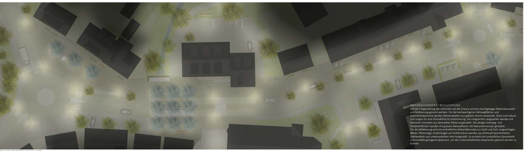
BELEUCHTUNGSPLAN M 1:200

MATERIALKONZEPT | BELEUCHTUNG Mit der Umgestaltung der Ortsmitte soll die Chance auf eine durchgängige Materialauswahl und Moblierung genutzt werden. Für die hochwertigeren Gehwegflächen und Aufenthaltsbereiche werden Bodenplatten aus gelbem Granit verwendet. Diese sind robust und sorgen für eine freundliche Grundstimmung. Die integrierten Längsparker werden mit kleineren Formaten aus demselben Material gestaltet. Die übrigen Gehweg- und Parkplatzzflächen werden mit grauem Betonpflaster mit Natursteinvorsatz gestaltet. Für die Moblierung wird ein einheitliches Materialkonzept aus Stahl und Holz vorgeschlagen. Bänke, Pflanztröge, Anlehnbügel und Anfahrtschutz werden aus Anthrazit beschichteten Stahlwinkeln und unbehandeltem Holz hergestellt. So entsteht ein einheitliches Gesamtbild und es bleibt genügend Spielraum, um den unterschiedlichen Ansprüchen gerecht werden zu können.