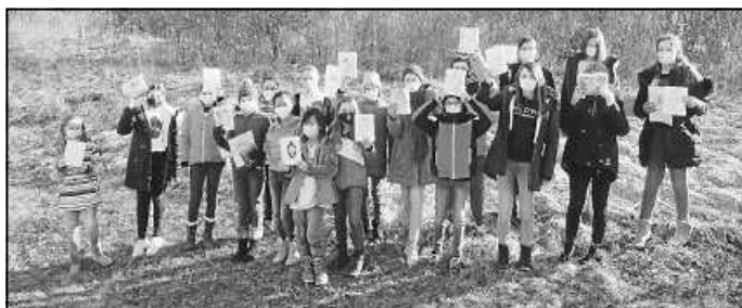
TeilnehmerInnen der Klassen 5 und 6