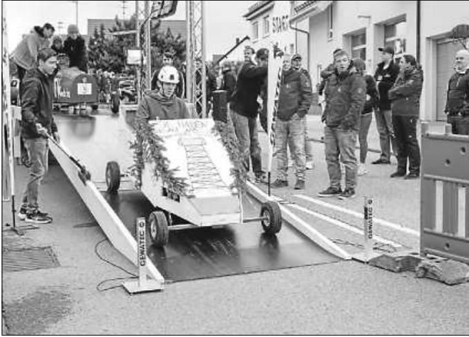
Keine bierernste Sache war das Seifenkistenrennen in Gosheim, bei dem auch kuriose Gefährte wie das des Albvereins durch Gosheim ratterten.