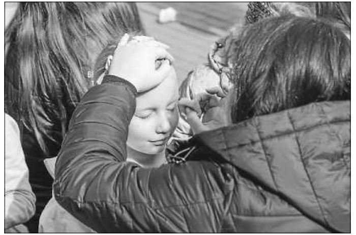
Das Kinderschminken kam bei den kleinen Besuchern in Gosheim bestens an.