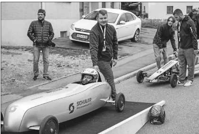
Wie auf der Rampe, so auch auf dem Podium: Azubi-Team 1 von Schuler Präzisionstechnik (links) vor dem Azubi-Team 2 des gleichen Unternehmens.