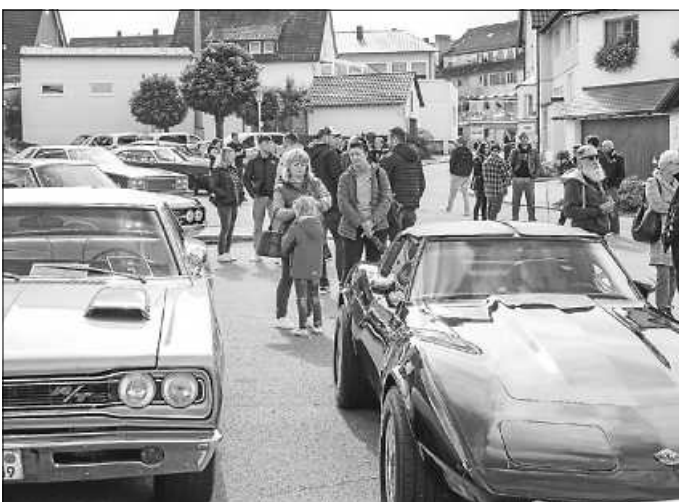
Auch wenn in diesem Jahr deutlich weniger US-Fahrzeuge in Gosheim zu Gast waren, so tat das dem Interesse der Besucher keinen Abbruch: So war immer viel Betrieb auf dem Treffengelände.