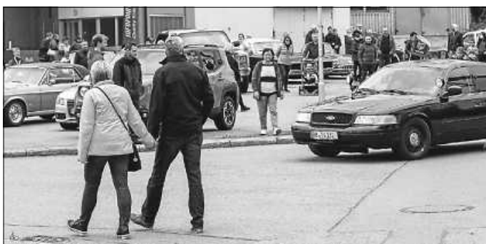
Besonders Mitfahrten in den US-Polizeiautos waren in Gosheim heiß begehrt und die Lose zugunsten der Freunde der Behinderten schnell verkauft. Rund 200 Euro konnten so an Spenden eingenommen werden.