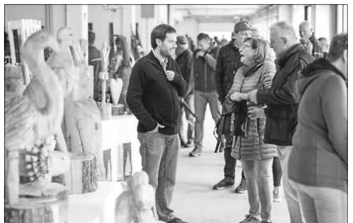
Auch auf dem Hobbykünstler-Markt in der Hermle-Uhrenfabrik herrschte zuweilen Hochbetrieb mit viel Publikumsandrang.