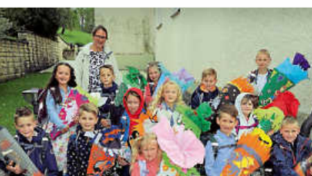
Einschulung Reichenbach / Egesheim