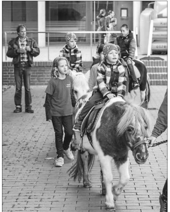
Für eine Runde auf einem Pony begeisterten sich zahlreiche kleine Besucher in Gosheim.