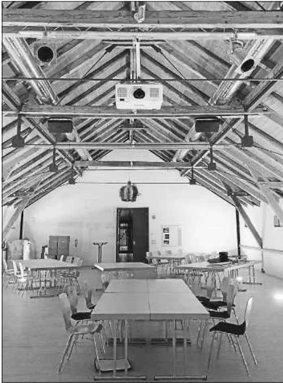
Die neue Medientechnik im Schafstall des Freilichtmuseums.

Das Programm „Soforthilfeprogramm Heimatmuseen und landwirtschaftliche Museen 2021“ wird gefördert vom Bundesministerium für Ernährung und Landwirtschaft und der Beauftragten der Bundesregierung für Kultur und Medien, aufgrund eines Beschlusses des Deutschen Bundestages. Träger ist der Deutsche Verband für Archäologie e.V. (DVA).