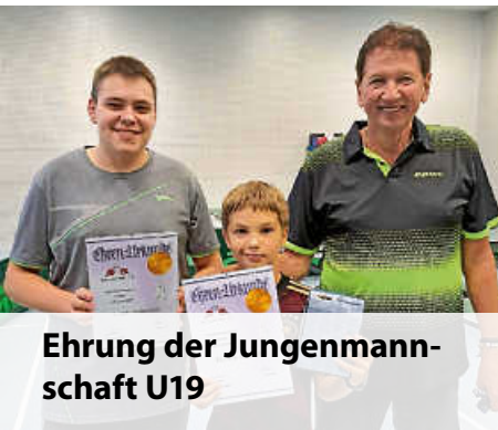
Ehrung der Jungenmann- schaft U19