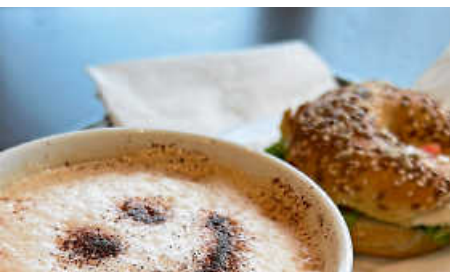
Einladung zum St. Ulrich- Senioren-Nachmittag