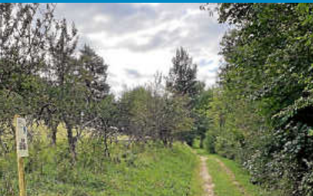
Neugestaltung des Panoramaweges