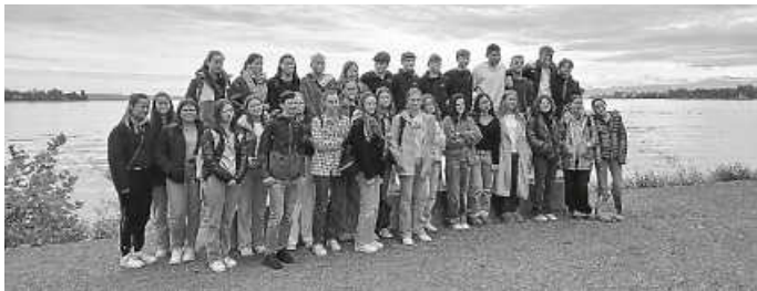
Schüler des GGW und des Lycée Vauban posieren gemeinsam bei dem Ausflug in Konstanz