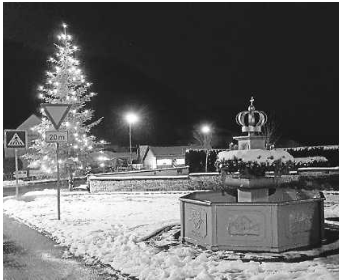
Geschmückter Kronenbrunnen mit Christbaum

Auch in diesem Jahr dürfen wir uns wieder über einen wunderschön geschmückten Adventskranz auf dem Kronenbrunnen freuen.