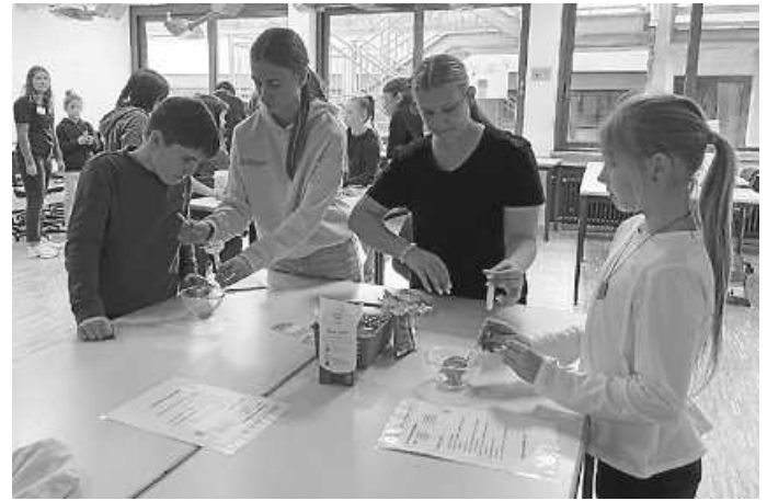
Beim Brausemischen haben die Schüler viel Spaß

Das Kollegium und die Schulleitung der Realschule freuten sich, dass die Besucher so zahlreich erschienen sind und für die verschiedenen Angebote großes Interesse gezeigt haben.