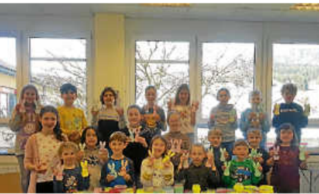
Musikernachwuchs zeigt Können

DER MUSIKVEREIN REICHENBACH LÄDT EIN ZUM