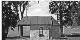
Foto: Hütte am Turm

Alle, die gerne draußen unter- wegs sind, laden wir ein zu unser- er Gemeindegewandung am Sonntag, 21. April. Wir treffen uns um 14 Uhr in Deilingen bei der Hütte am Turm und laufen eine schöne Runde über das Montschenloch (1004 m) bis zur Deilinger Kapelle und über den Teerweg zurück; je nach Lust und Laune der Mitwandernden auch noch über den Bol (1002 m). Es ist ein gut gangbarer Weg von 3