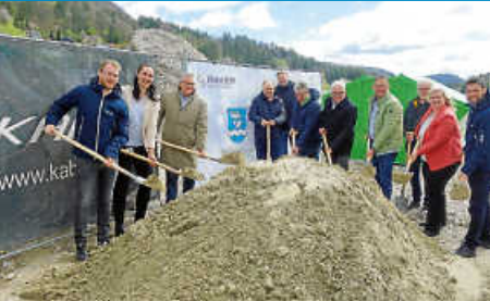
Ausbau des Breitbandnetzes