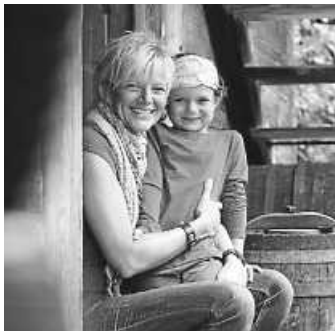
Am Sonntag, 19. Mai, dem Internationalen Museumstag, kündigt sich bei freiem Eintritt hoher Besuch im Freilichtmuseum Neuhausen ob Eck an.

Neuhausen ob Eck. Im Mai stehen im Freilichtmuseum Neuhausen ob Eck erste Veranstaltungshöhepunkte an: Am Sonntag, 12. Mai, bieten sich am „Muttertag“ für alle Mütter eine ganze Reihe an besonderen Angeboten. Freier Eintritt und der Live-Besuch historisch gewandeter Städter bei ihren Verwandten auf dem Land sind starke Argumente für einen Museumsbesuch am Internationalen Museumstag am Sonntag, 19. Mai. Tags darauf am Deutschen Mühlentag steht natürlich die Museumsmühle im Zentrum des Geschehens. Schließlich besteht ab Mai die Möglichkeit, die Sonderausstellung „Ein roter Faden durchs Museum: TEXTIL“ in Augenschein zu nehmen.