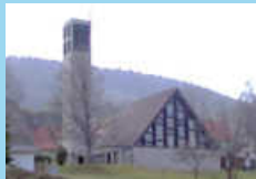
Evangelische Christuskirche, Wehingen