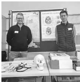
Ehemalige Schüler stellen ihren Berufsweg vor

Vierzig ehemalige Schülerinnen und Schüler, sogenannte Alumni, statteten dem Gymnasium Gosheim-Wehingen für einen ganzen Vormittag einen Besuch ab. Das Ziel dieses Alumniforums war es, den angehenden Abiturienten Hilfestellung zu bieten. Dabei ging es um vielfältige Anliegen: die Wahl der Studienfächer und Studienorte oder die Wahl zwischen Hochschule, dualen Studium, Uni oder einer Berufsausbildung.