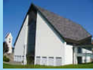
Christi Himmelfahrt, Deilingen