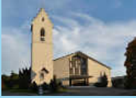
Heilig Kreuz, Gosheim