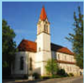
St. Ulrich, Wehingen