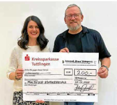
Spenden beim Brauchtumsabend