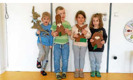
Bastelnachmittag im Kindergarten