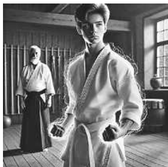
Sensei und Karateka

Willst du auch dein Kiai finden? Egal, ob du dich verteidigen lernen, deine Fitness verbessern oder einfach eine faszinierende Kampfkunst meistern möchtest – Shotokan Karate