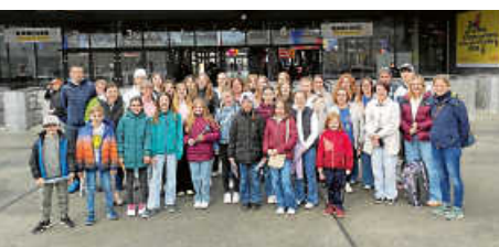
TVW beim Turnwettkampf