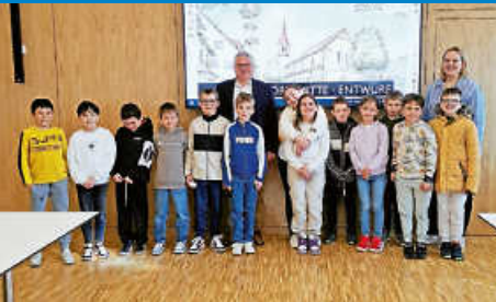
Besuch von Schüler-/innen auf dem Rathaus

Diese Ausgabe erscheint auch online auf NUSSBAUM.de