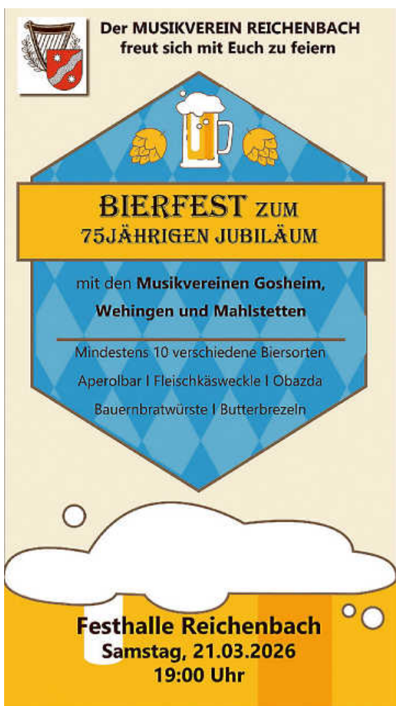
Plakat: Musikverein Reichenbach