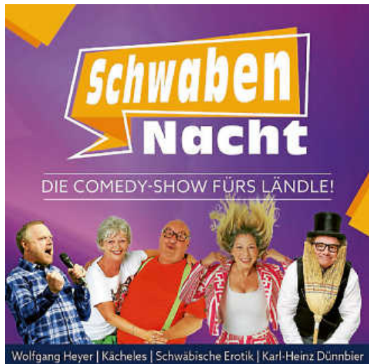
Plakat: Schwäbische Comedy

Der Kulturverein holt 2027 mit der Schwabennacht wieder vier Comedy-Künstler nach Wehingen für einen Abend voller Comedy , Kabarett und Musik , gewürzt mit allem, was das Schwabenland so liebenswert macht: viel Herz , eine ordentliche Portion Schlitzohrigkeit und Pointen , bei denen selbst die Maultaschen vor Lachen im Teller tanzen!