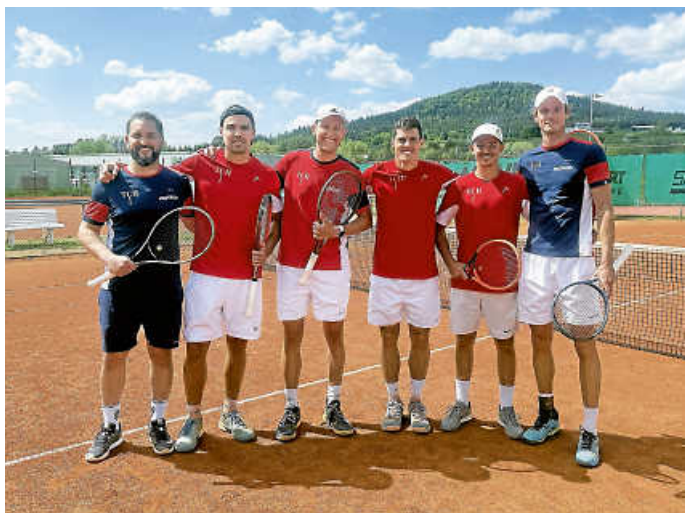
TCH-Dreamteam 2026: Ohne Niederlage in die Württembergliga

Zum Abschluss blieb eine Erkenntnis, die an diesem Abend immer wieder spürbar war: Der TC Heuberg lebt von seinen Menschen und den vielen Sponsoren, die den Club tatkräftig unterstützen. Vom Einsatz auf dem Platz, vom Engagement dahinter – und von dem besonderen Zusammenhalt, der diesen Verein ausmacht. Fazit: Der TC Heuberg ist sportlich auf dem Höhepunkt – und steht gleichzeitig vor wichtigen Weichenstellungen für die Zukunft.