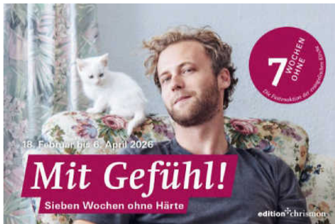
Plakat: 7 Wochen ohne

Die Verstrickungen, in die Menschen geraten können, sind nicht zu verharmlosen: Jemand hat Geld veruntreut. Und damit es nicht herauskommt, kommt eine Kette von Vertuschungen in Gang - eine Spirale, die nicht zu stoppen ist. Oder um in der eigenen Karriere schneller voranzukommen, denunziert jemand einen Kollegen und verfolgt ihn mit Bosheit. Die eigenen Kräfte sind meist zu gering, um sich aus diesem Netz von Lügen und Versagen zu befreien. Eine wirkliche Veränderung tritt nur ein, wenn wir uns dem Sohn Gottes anvertrauen, ganz auf seine Macht bauen. Unser Sinneswandel -Buße, Umkehr - führt dazu, dass ein Ausstieg aus der Spirale möglich ist, das Böse seinen Schrecken und der Teufel seine Macht über uns verliert. Das ist keine harmlose Angelegenheit, wie die Legende des heiligen Georg zeigt, der dem Bösen im Sinnbild des Drachen energisch entgegentritt - im Namen Christi. Mit dem Teufel kann man sich nicht versöhnen. Hier geht es um Leben oder Tod.