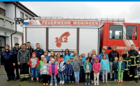
Ferienprogramm der Freiwilligen Feuerwehr