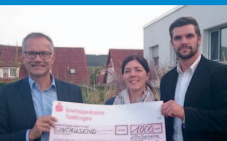
Spende an das Hospiz in Spaichingen