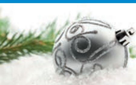
Verschenken Sie doch ein Stück KULTUR!