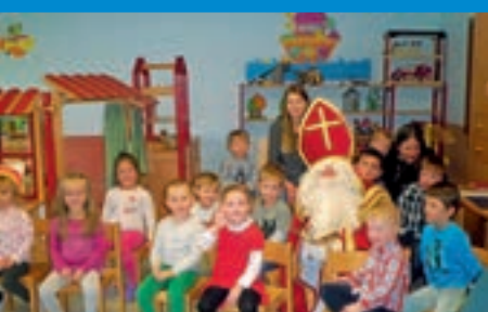
Kindergarten Egesheim Der Nikolaus war da!