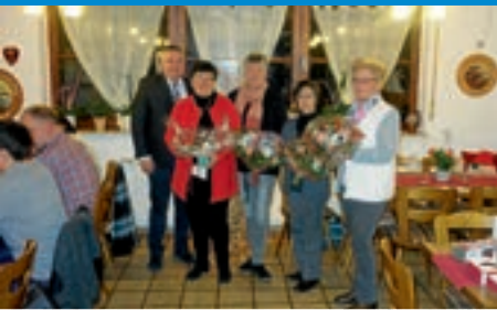
Jahresabschlussfeier der Bediensteten 2017