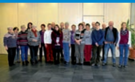
16.12.17, 18 Uhr, Aufführung des Chorprojekts.