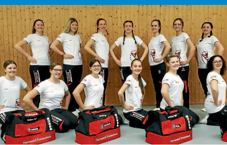
Die Narrenzunft sagt DANKESCHÖN