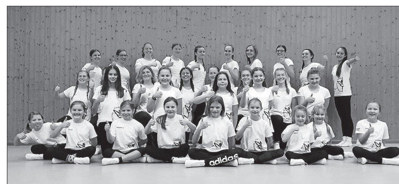
gezeichnet - Narrenzunft Reichenbach