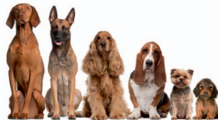
Standorte der Hundetoiletten in Wehingen