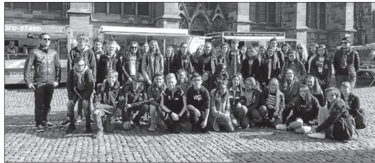
Das Foto zeigt die Austauschschüler vor dem Freiburger Münster.

Ein harmonisches Abschlussfest am Freitagabend rundete die Austauschwoche auf dem Heuberg ab.