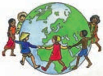
Kinder- und Jugendtag am 2.6.2018