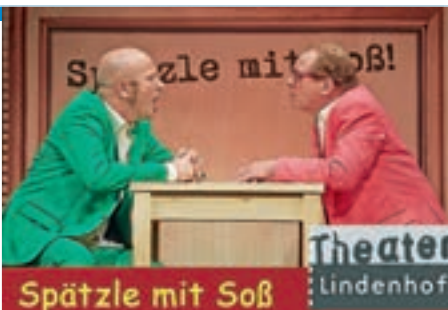
Samstag, 23. Juni 2018 in der Schlossberghalle