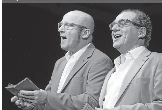
Eine heitere Schwabenkunde von Berthold Biesinger und Bernhard Hurm.