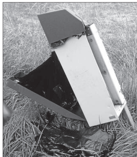
Sachbeschädigung ist kein Kavaliersdelikt!!

Auf dem Radweg zwischen Wehingen und Gosheim wurde eine Hundetoilette beschädigt. Wir haben dies beim Polizeiposten zur Anzeige gebracht. Wer sachdienliche Hinweise dazu machen kann, bitten wir sich auf dem Rathaus oder auf dem Polizeiposten, Tel. 07426/1240 zu melden.