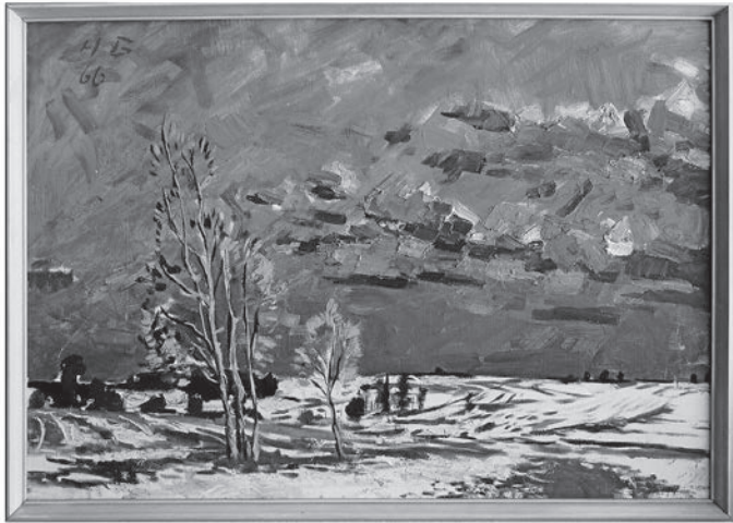
Die Ausstellung zeigt auch Werke von Hans Bucher, darunter zahlreiche Leihgaben aus dem Museum Oberes Donautal und der Hans-Bucher-Stiftung in Fridingen. Foto: Hans Bucher „Winterlandschaft“, 1968, Öl auf Leinwand, Kunstsammlung des Landkreises.