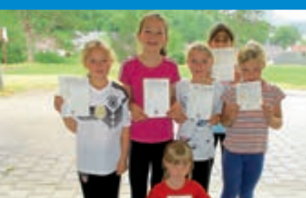
Bundesjugendspiele an der Grundschule Reichenbach