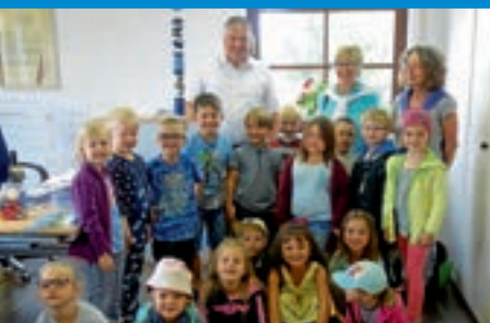
Kindergartenkinder gratulieren dem Bürgermeister