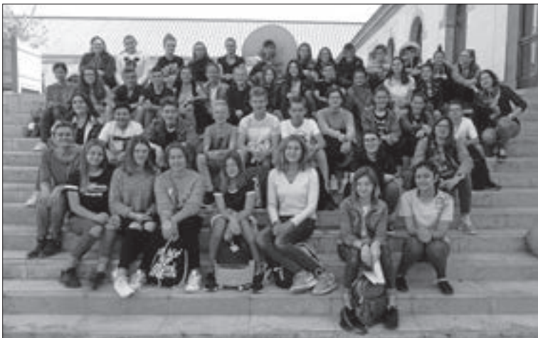
Das Foto zeigt die Austauschschüler mit ihren Gastgebern

An den anderen Tagen standen auch unterhaltsame und gruppenstärkende Unternehmungen auf dem Programm. So hatten alle Schüler viel Spaß beim gemeinsamen Schlittschuhlaufen, amüsierten sich bei Stadtrallyes und bei einem gemeinsamen Quiz über Europa im Geburtshaus von Robert Schuman, einem der Gründerväter der Europäischen Union. Deshalb war es auch nicht weiter verwunderlich, dass sich schnell Freundschaften bildeten und gemischte Gruppen aus Deutschen und Franzosen gemeinsam ihre Freizeit verbrachten. Doch natürlich durfte auch der Besuch im Unterricht nicht fehlen. Hier merkten die Schüler schnell, dass es erhebliche Unterschiede zwischen den beiden Ländern gibt, sowohl im Unterricht als auch in der Schulorganisation.