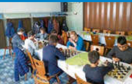
Schachring: Vereinsjugend- einzelmeisterschaft 2019