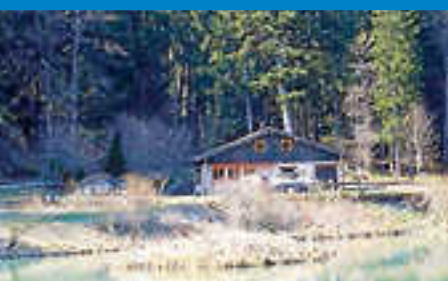
Angelverein: Hüttenbewir- tung am 1.5. und 30.5.