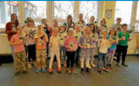
Palmsonntagsvorspiel des Musikvereins Wehingen