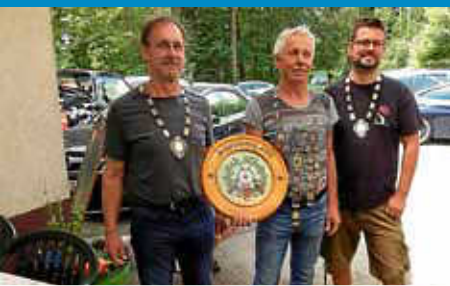
Königsschießen des Schützenvereins Wehingen