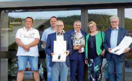
Die verabschiedeten und geehrten Gemeinderäte